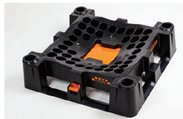
het onderstel van de Indus Neva met gesloten schuiw