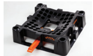
het onderstel van de Indus Neva met geopende schuiw voor (gedoseerde) onderlossing