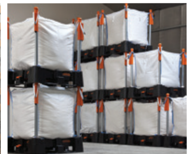
ruimtebesparende opslag (max. 4 hoog x 1.500 kg.)