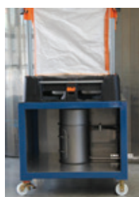
lossen én verder transport