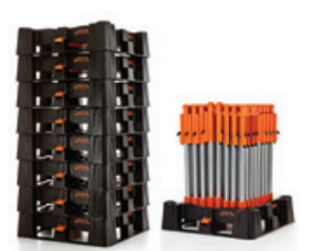
gereduceerd volume indien even niet in gebruik

Improving your bulk storage and logistics