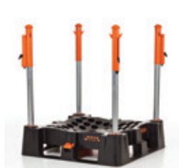
het complete Indus Neva Systeem